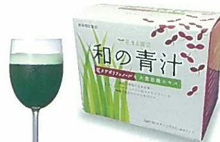
粉末タイプ (1箱:3g×30スティック入り)